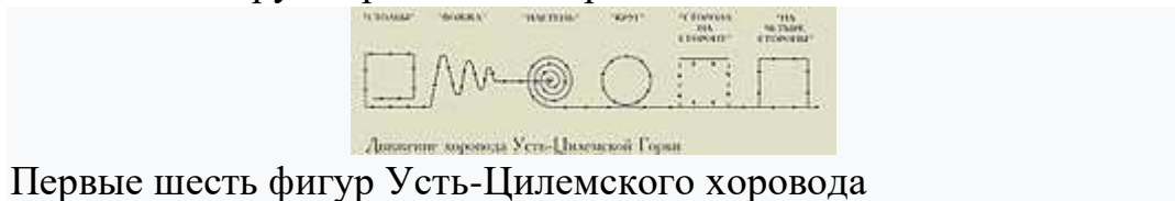
Первые шесть фигур Усть-Цилемского хоровода